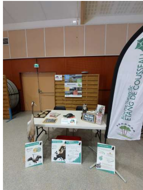
Stand lors du forum des associations de Lacanau, en septembre 2022.