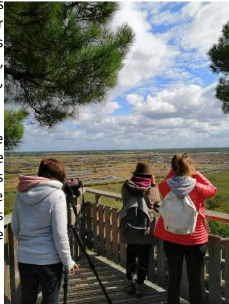
Observation depuis la tour de Lesperon, lors d'une visite

Les inscriptions sont effectuées par l'Office de Tourisme Médoc-Atlantique avec lequel nous avons une convention de partenariat. Le tarif est fixé à 5 € pour les adultes et 2 € pour les enfants (gratuit pour les moins de 8 ans – tarif enfant applicable jusqu'à 16 ans et pour les demandeurs d'emploi) ou alors elles peuvent être gratuites.