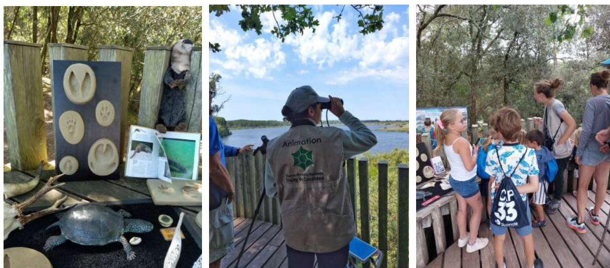
Présentation des outils d'accueil posté sur le belvédère.

Le recrutement du personnel saisonnier (1 guide saisonnière et 5 écovolontaires en 2022) nous permet d'assurer l'accueil du public lors des fortes fréquentations estivales du site.