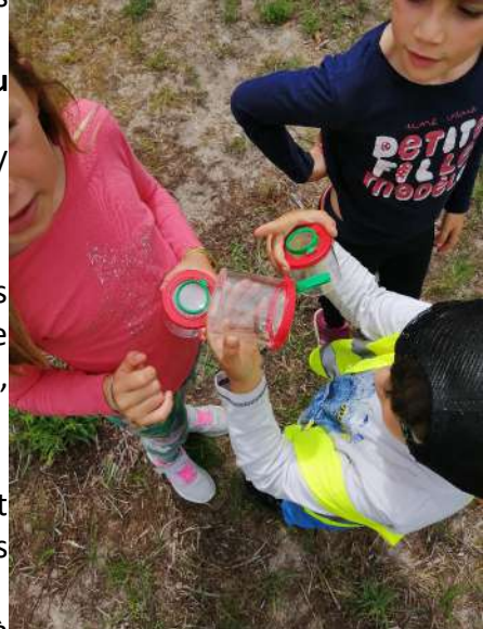
Animation scolaire dans la Réserve Naturelle avec l'école de Lacanau Océan.

Pour cela nous avons mis en place un document téléchargeable sur le site internet de la SEPANSO, par les enseignants.