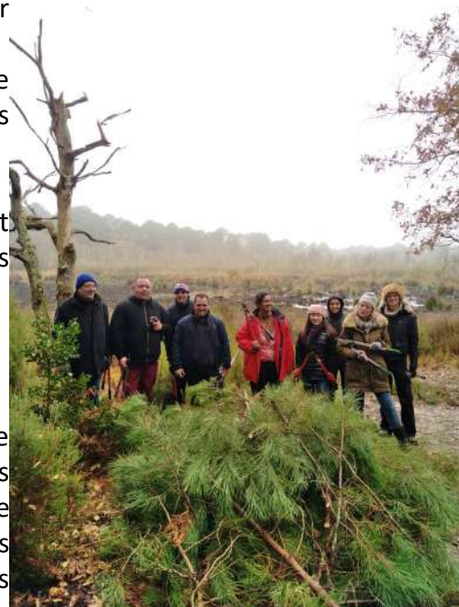
Chantier nature avec le personnel du château Lafite.

Il est plus judicieux de continuer à proposer ce type d'activité à des associations ou à des groupes d'étudiants afin d'agir dans le cadre de journée environnement, d'une réinsertion ou dans le cadre des études (lycée agricole, MFR...). C'est ce que nous