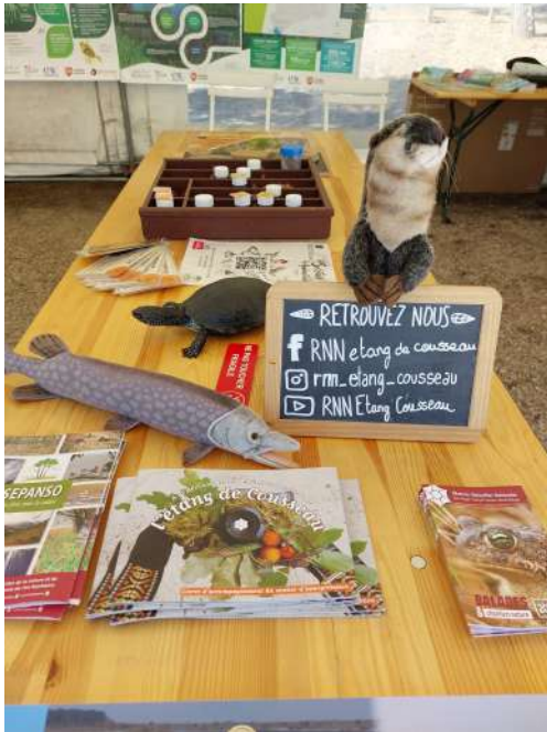
Stand de la Réserve Naturelle lors de la Fête de l'Environnement et de la Forêt.