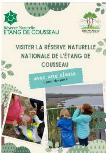
Document à destination des enseignants