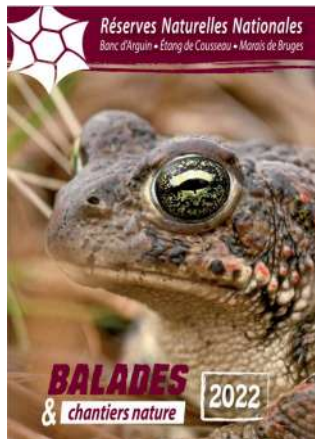
Couverture de la programmation des visites guidées 2022 sur les 3 Réserves Naturelles

gens de passage en période estivale, ils sont pour la plupart passés dans l'un des offices de tourisme Médoc-Atlantique pour prendre connaissance des activités auxquelles ils pouvaient participer.